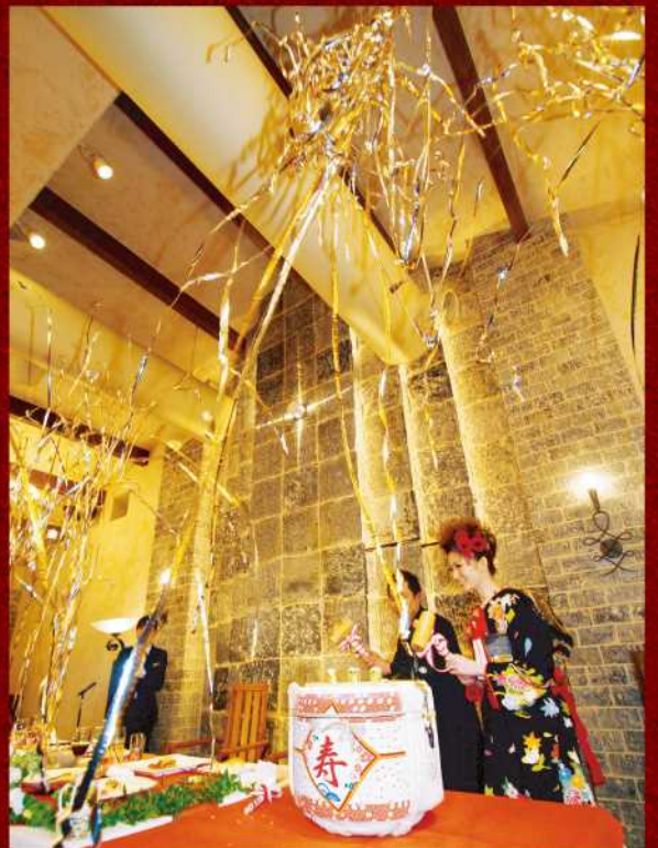
鏡開き用クラッカー樽 【四斗樽タイプ】

本格的な樽としてお使いいただける四斗樽サイズです。中にお酒やプレゼントなどを入れてお使いいただけます。 【サイズ】外寸：径65cm×高さ65cm 釜容量：9L 【タイプ】約4m散らかる・約2m散らからない・約3m桜吹雪